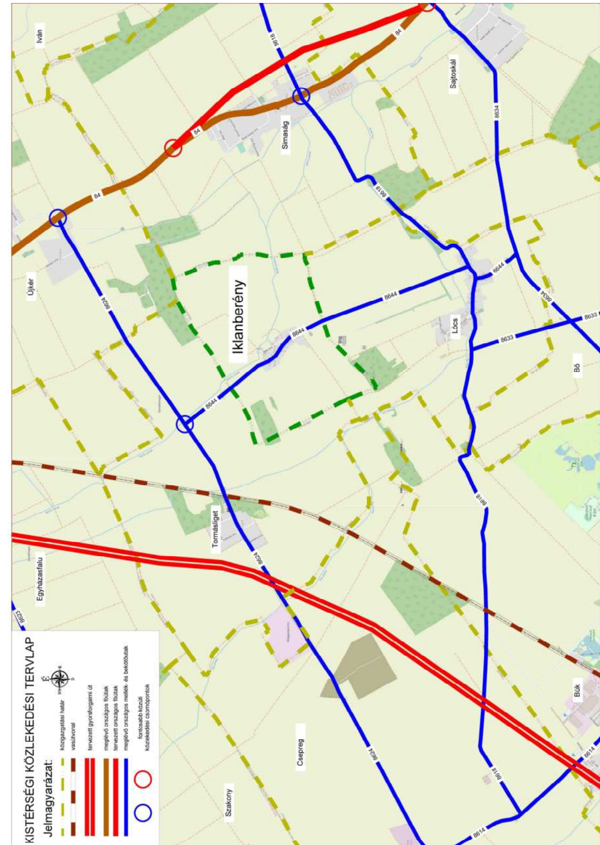
4.6 Közművesítés, elektronikus hírközlési javaslat Vízellátás