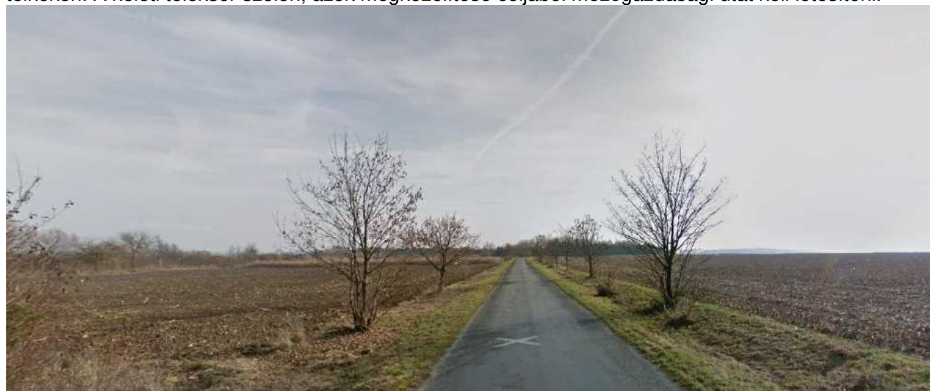
A Tormásliget felől bevezető út mellett balra a szántók, a kép bal szélén a Metőc patakot kísérő fasor

- Az igazgatási terület északi felén, a Tormásliget felől érkező út és a Metőc patak között, valamint attól keletre lévő területen a hatályos terv hatalmas kertés mezőgazdasági területet jelöl. Időközben a lakossági igények változtak, e földrészeket amint az az alábbi képen látható, jelenleg szántó művelést folytatnak, kertgazdálkodást nem. Az önkormányzat a kertés művelés lehetőségét meghagyva, de jóval kisebb terület kijelölése mellett döntött, csak egy-egy teleksáv maradjon ebben a területfelhasználási módban a Metőc patak két oldalán sorakozó, meglévő kisebb méretűen osztott telkeken. A keleti teleksáv szélén, azok megközelítése céljából mezőgazdasági utat kell létesíteni.