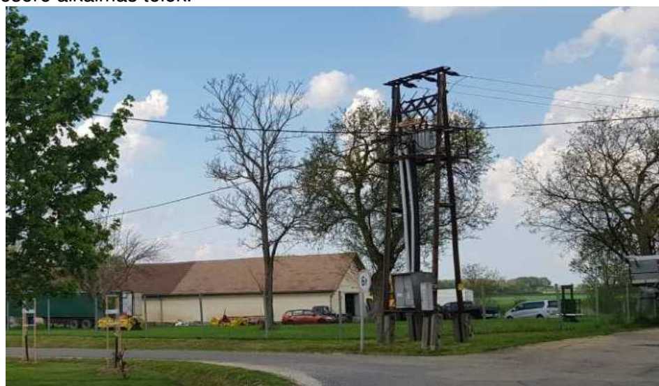
A major a központi térről nézve

- A hatályos terven az 1/1 hrsz, a major déli része, kereskedelmi – szolgáltató terület. A major funkció már régóta nem működik, kereskedelem és szolgáltatás céljára sem alakították át az ott lévő épületet. Különböző, gyakran változó más célokra használják. A tulajdonos kérése az, hogy kerüljön át lakóterületbe, ami kedvező, mert a környező telkek lakótelkek, az ott álló pajtászerű épület le lesz bontva és lakóház épül a helyére, ami a közeli településközponttal való összelátás szempontjából kedvező lesz. A mellette elhaladó 043/6 hrsz. útra nyílóan leválasztható belőle két darab, szintén lakóépület építésére alkalmas telek.